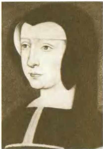
Луиза Савойская, мать Франциска I. Портрет XVI в.