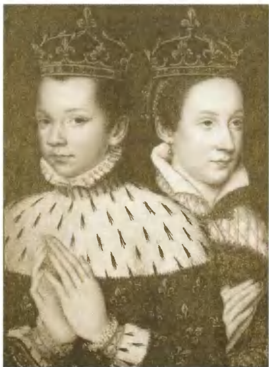
Франциск II и Мария Стюарт. Миниатюра XVII в.