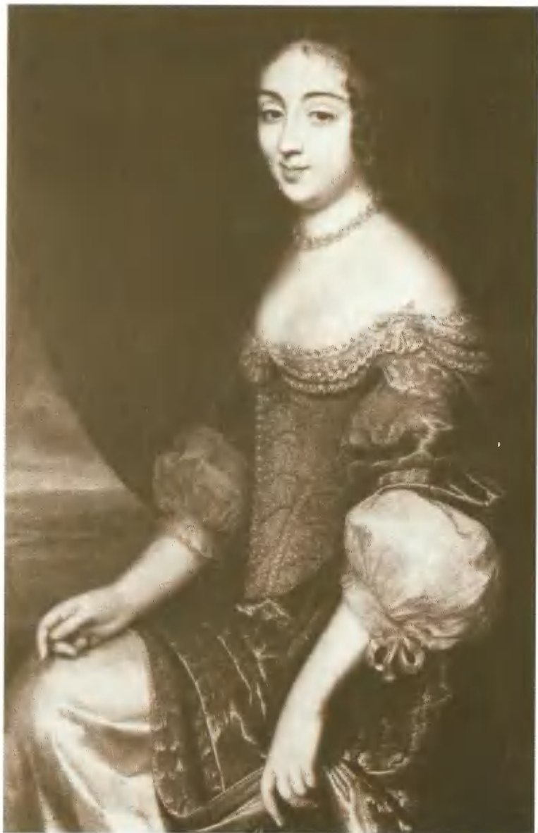
Анна Австрийская, супруга Людовика XIII. Портрет Ф. Шампень.