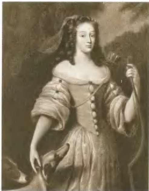
Герцогиня Луиза де Лавальер, фаворитка Людовика XIV. Портрет Нокре.