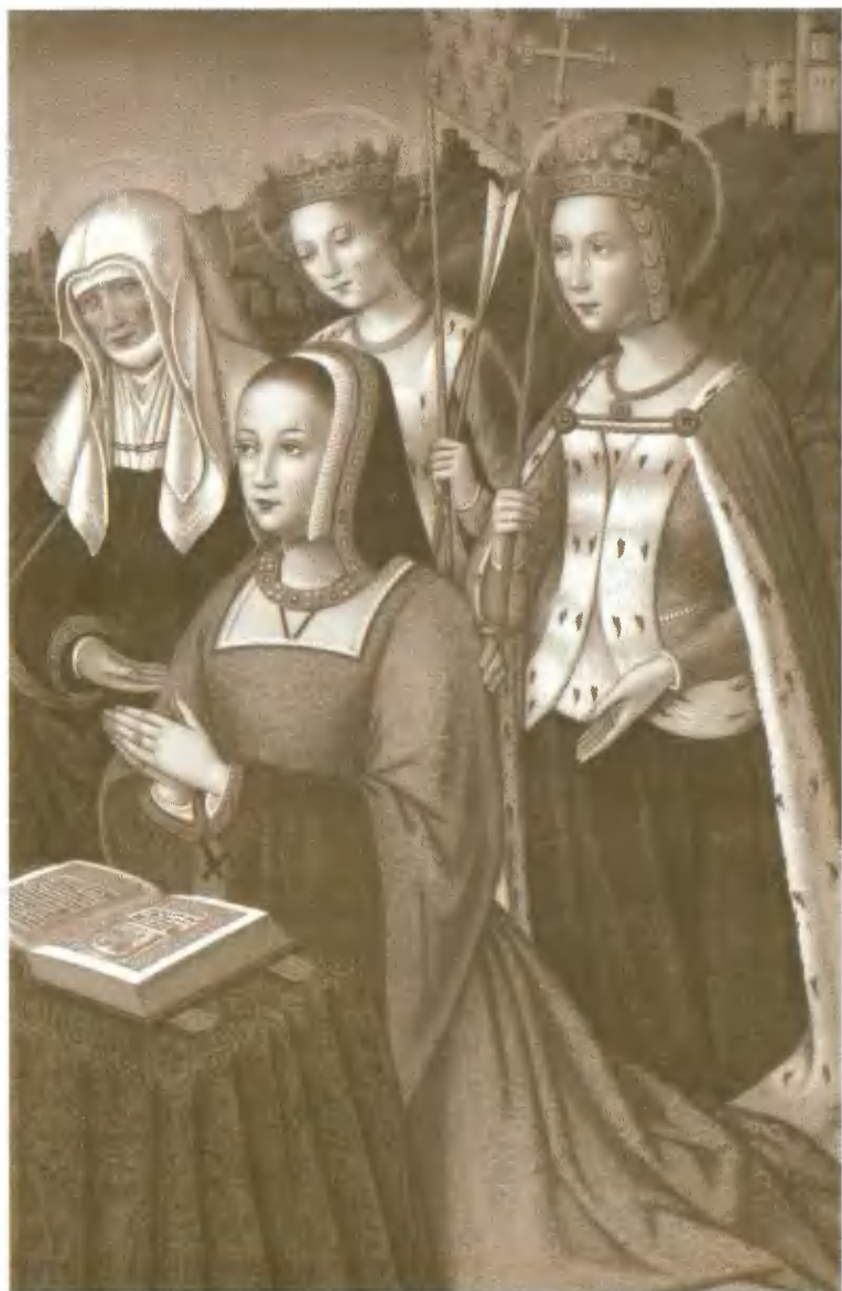
Анна Бретонская, супруга Карла VIII и (вторым браком) Людовика XII. Миниатюра конца XV в.