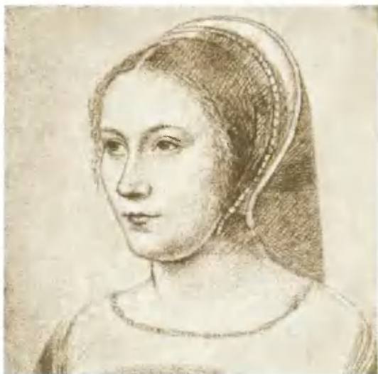
Анна де Писле, герцогиня Этампская, фаворитка Франциска I. Рисунок Ж. Клуэ