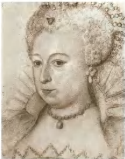
Маргарита Валуа («Королева Марго»), первая супруга Генриха IV. Рисунок XVI в.