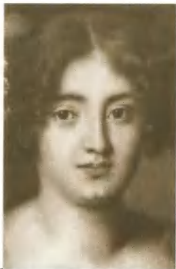
Мария Манчини, фаворитка Людовика XIV. Портрет XVII в.