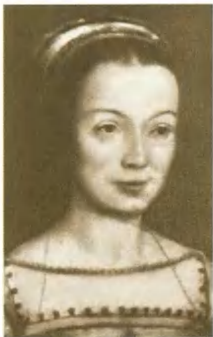
Клод Французская, супруга Франциска I. Портрет К. де Лиона.