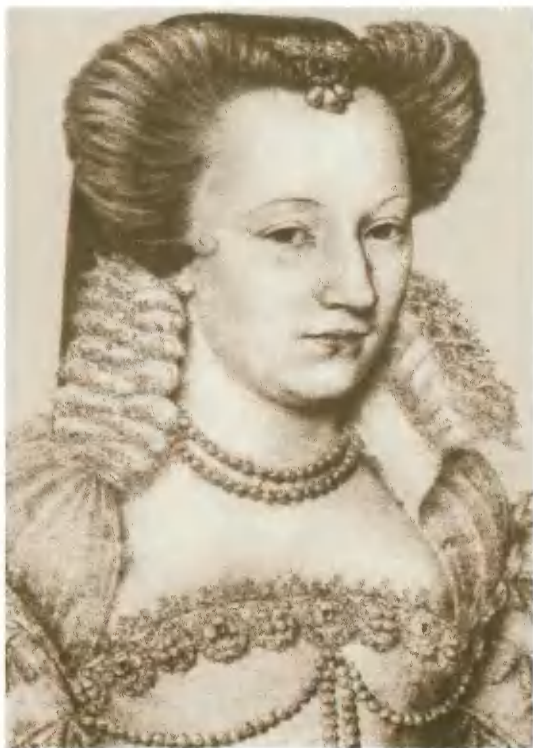
Луиза Лотарингская (де Водемон), супруга Генриха III. Портрет XVI в.