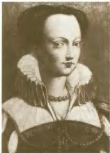
Елизавета Австрийская, супруга Карла IX. Портрет Ф. Клуэ.