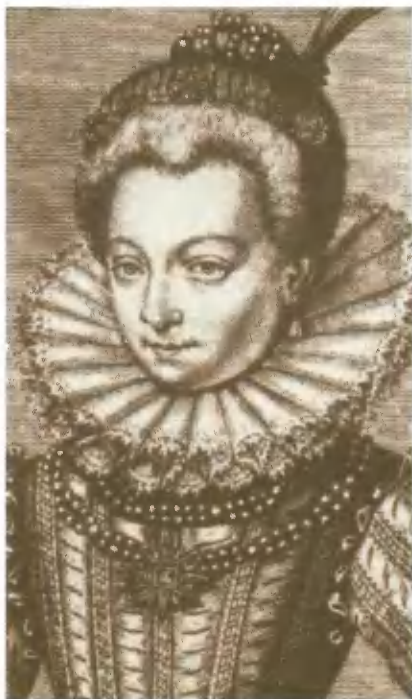
Генриетта Бальзак д'Антраг, фаворитка Генриха IV.