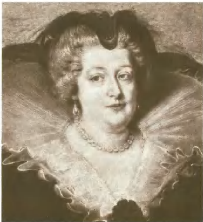
Мария Медичи, вторая супруга Генриха IV. Портрет Рубенса.