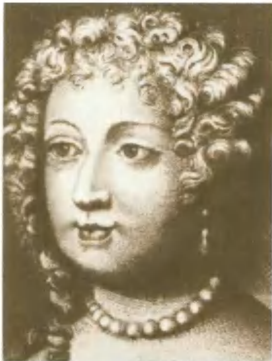
Мария-Тереза Австрийская, супруга Людовика XIV.