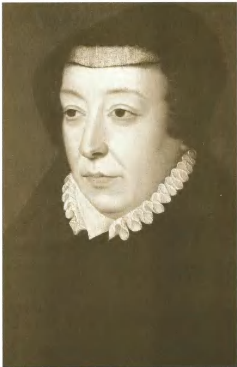
Екатерина Медичи, супруга Генриха II. Портрет Ф. Клуэ.