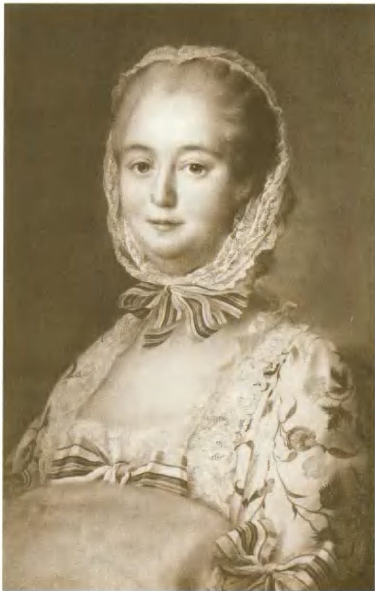
Маркиза де Помпадур, фаворитка Людовика XV. Портрет Друэ.