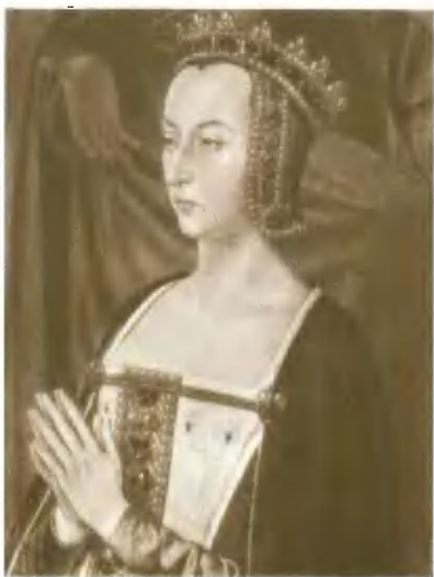
Анна Французская (де Боже), регентша в малолетстве Карла VIII. Портрет XVI в.