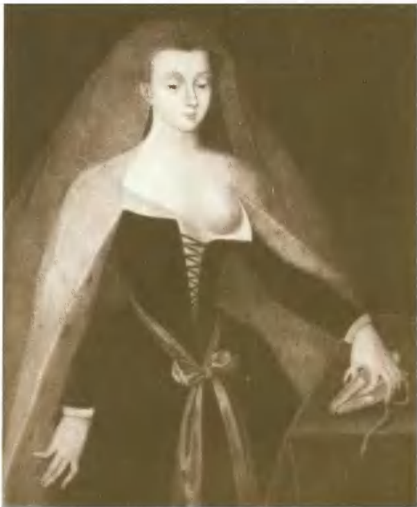
Агнесса Сорель, фаворитка Карла VII. Портрет Ж. Фуке.