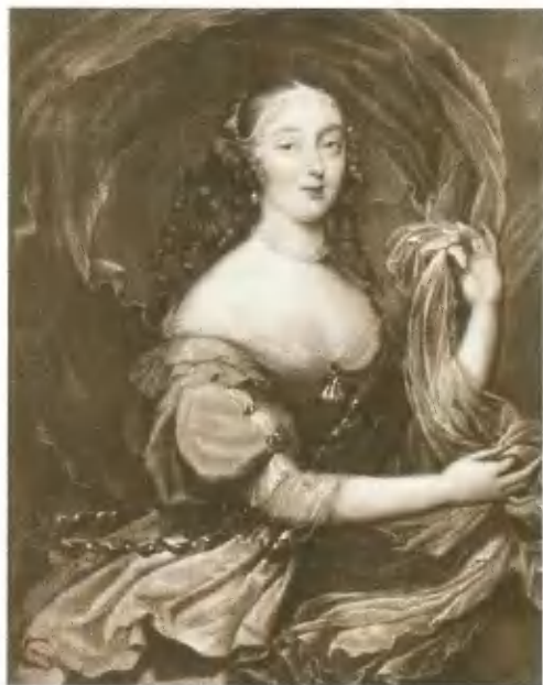
Маркиза де Монтеспан, фаворитка Людовика XIV. Портрет Миньяра.