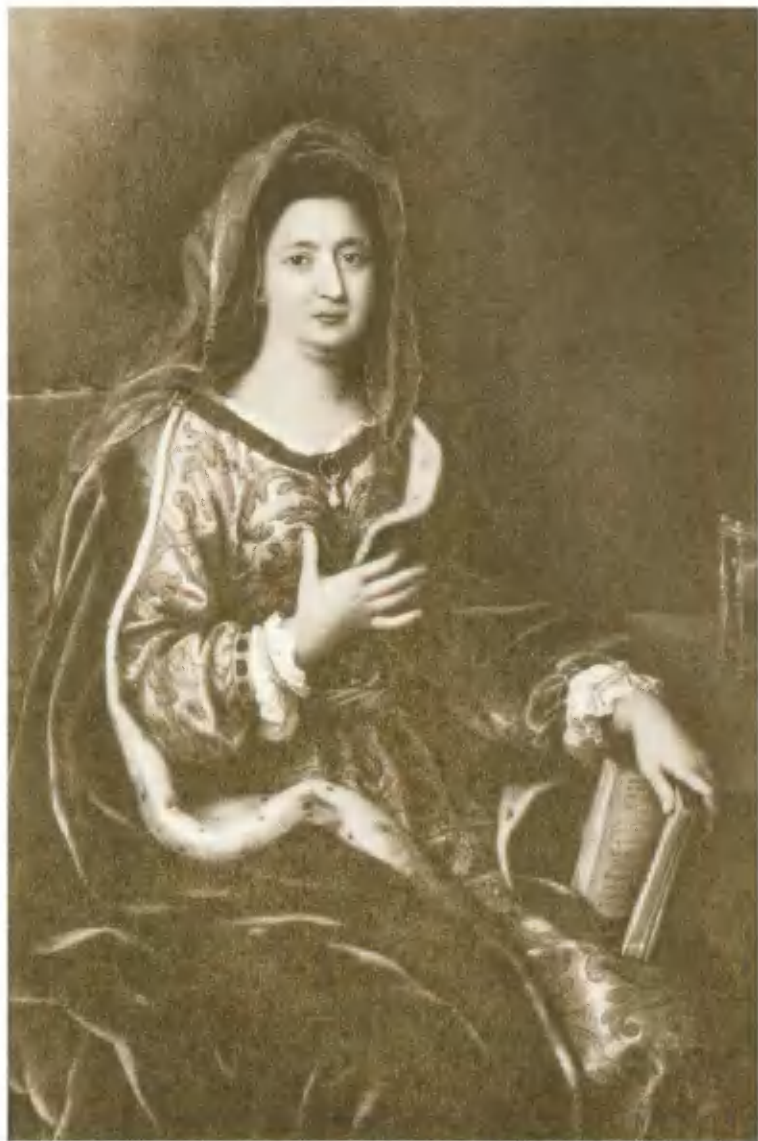
Маркиза де Ментенон, фаворитка Людовика XIV. Портрет Миньяра.