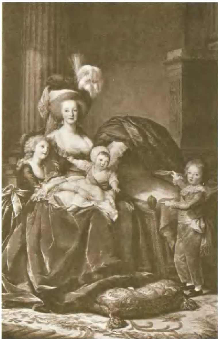
Мария Антуанетта, супруга Людовика XVI, с детьми. Портрет Виже-Лебрен.